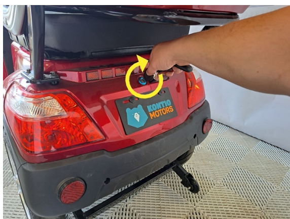
Avaa penkki avaimella.