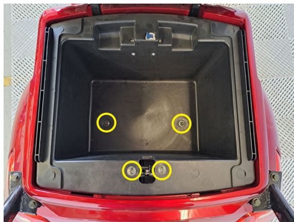
Irrota säilytyskotilon neljä kiinnityspulttia. (hylsy 8 mm).