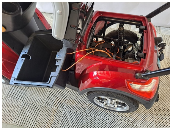
Nosta säilytyslokero sivuun.